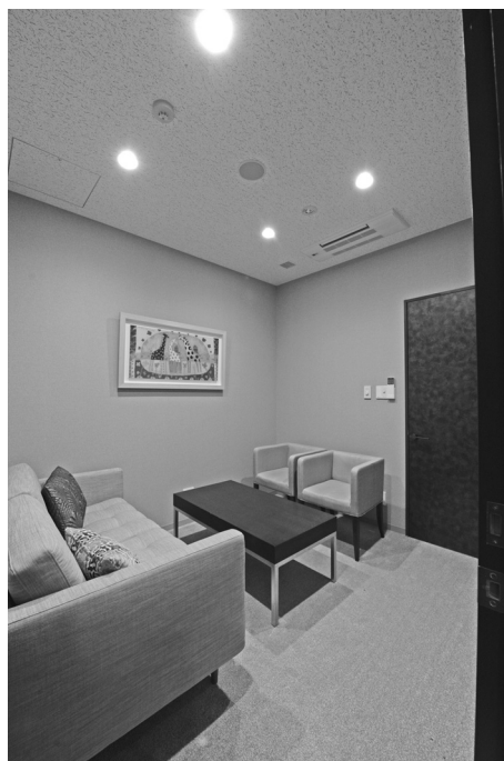
カウンセリングルーム

れとした笑顔を見せて頂き深々と頭を下げてくださいましたこと。その瞬間、私はこんなにも人を笑顔にでき