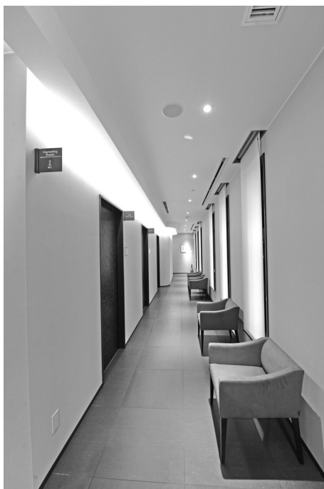
1階玄関内から見た鍼灸ルーム